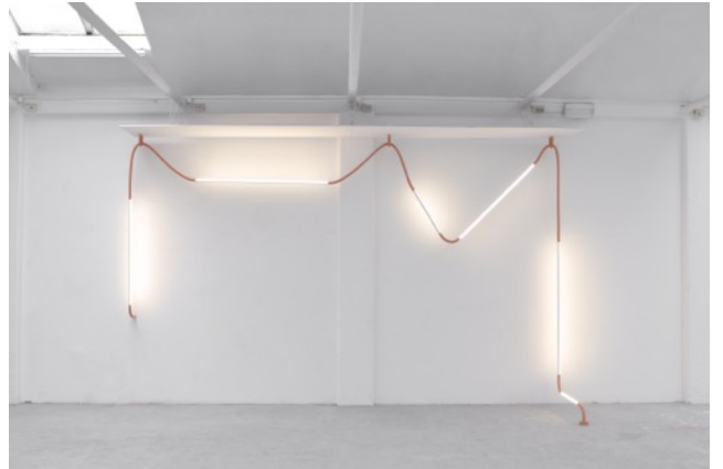
Stefan Peters „Untitled“ uit de reeks „Chronicles“