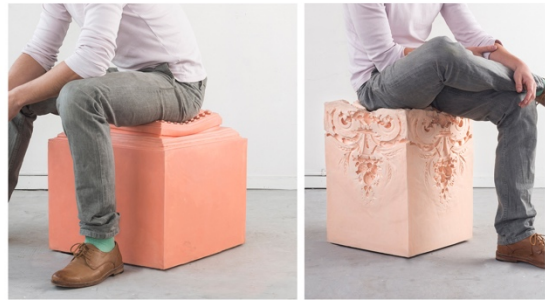
Michal Avraham en Borch Socher „Chocolate Rocks“